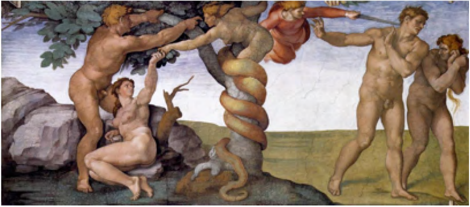
Cennet bahçesinde ilk Günah ve Sürgün, Michelangelo

Âdem karısı ile yatar, Havva hamile kalır Kayın'ı -Kabil- doğurur, ardından Habil. Kabil tanrıya sundukları armağan yüzünden kıskandığı kardeşi Habil'i öldürür. Bunun üzerine lanetlenir, Nod topraklarına yerleşir ve burada çocukları olur ve kendi soyundan gelenler için bir kent inşa eder. Karısı Hanok'u doğurur. Hanok'tan İrat, İrat'tan Mehuyael, Mehuyael'den Metuşael, Metuşael'den Lemek doğar. Havva yeniden hamile kalır, Şit adında bir oğlu daha olur. Ondan da Enoş doğar, insan soyu Âdem ve Havva soyundan gelenlerle bugüne değin gelir. (İncil'e ilişkin bilgiler için bkz. Yeni Çeviri 2009, http://incil.info/kitap/gen/5 ).