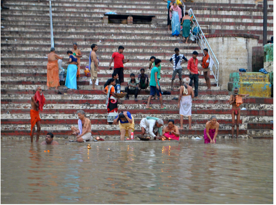
Su Unutur