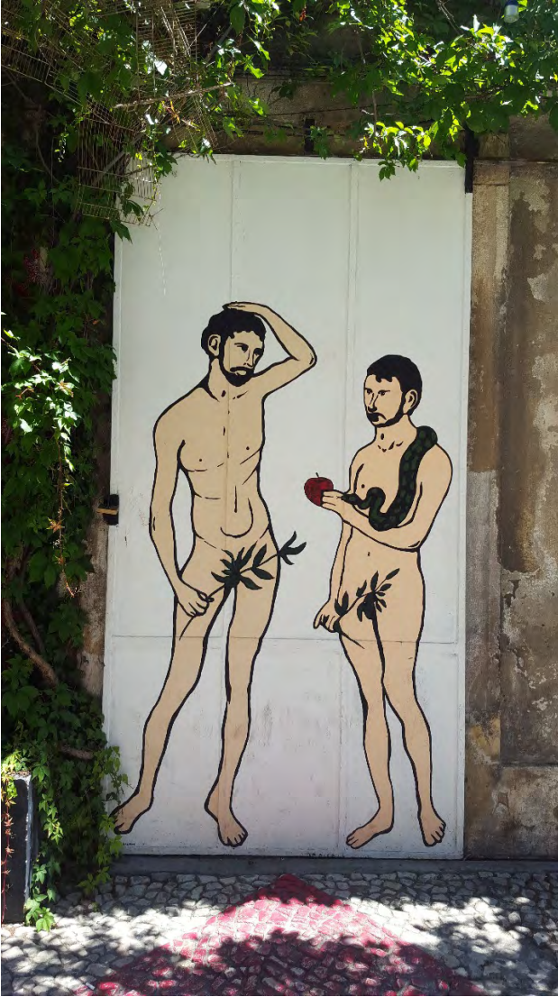
Özge Calafato Fotoğraf