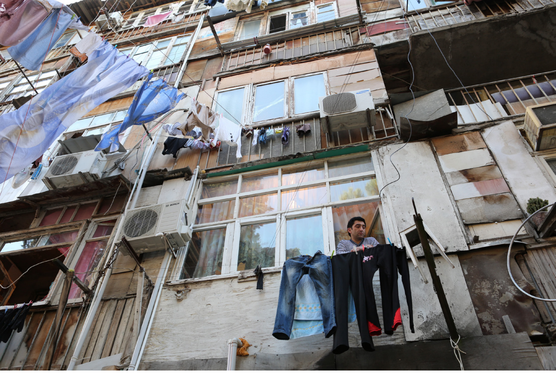
Kurtuluş Özgen Fotoğraf