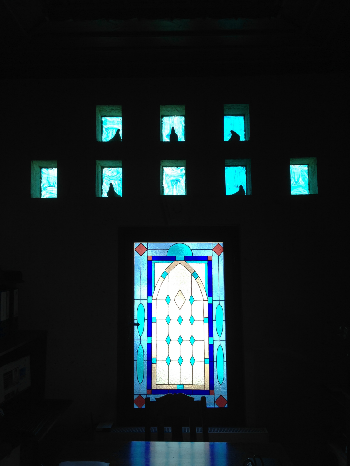
Şükriye İnan Çalapkulu Fotoğraf