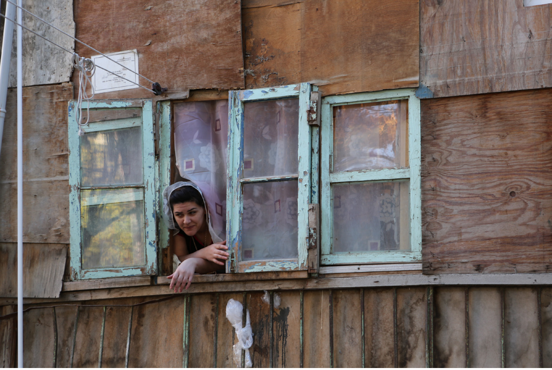
Kurtuluş Özgen Fotoğraf