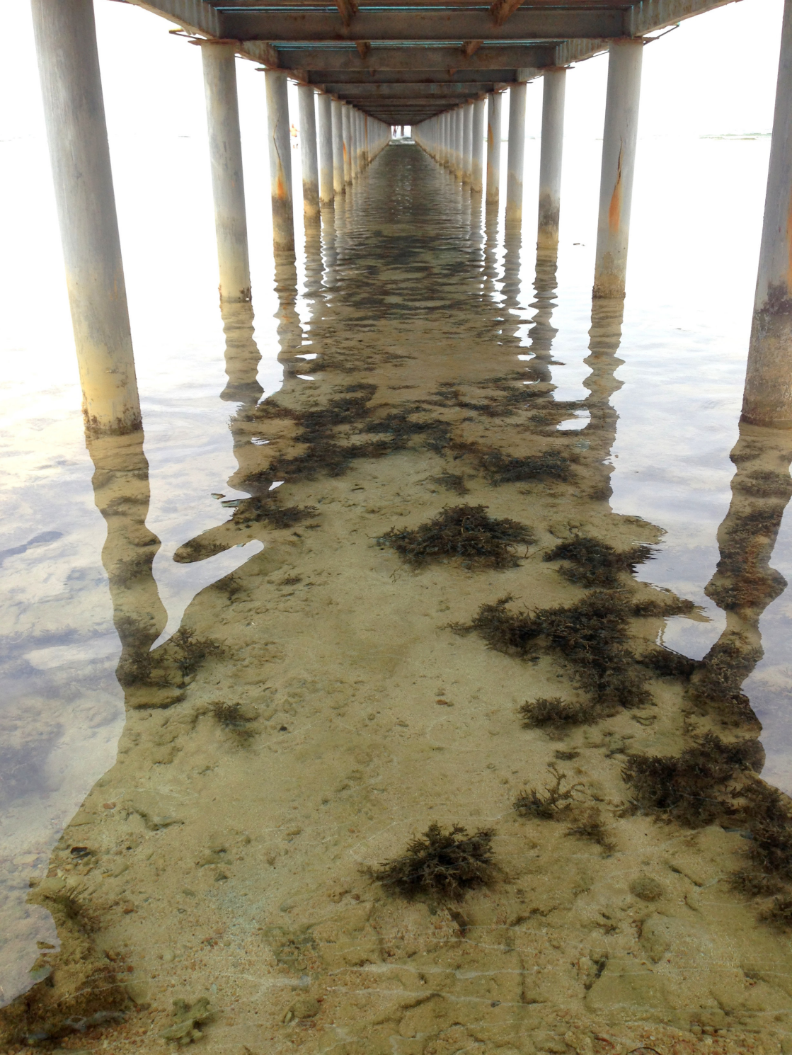
Şükriye İnan Çalapkulu Fotoğraf